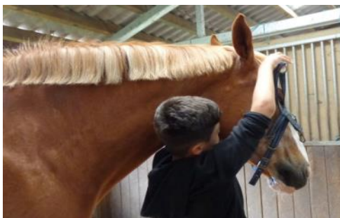
Approche du cheval

Le MATAS "trajectoire" est placé sous la responsabilité conjointe de la DGEO-CRENOL et de l'Association de la Maison des Jeunes à Lausanne.